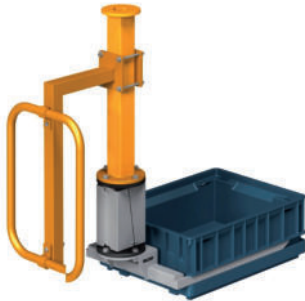
Gabelwerkzeug mit Parallelspanner für KLT-Kisten LAM - Nr. LHA 2204