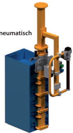
Mehrfach KLT-Greifer für gestapelte KLT Kisten LAM - Nr. LHA 02.24A