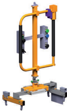
Parallelspanner zum Handling von Silverline KLT Kisten von 600 x 400 und 300 x 200 LSP 19.06