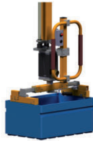
KLT-Greifer für eine Größe Für zwei Größen mit manueller Schnellverstellung LAM - Nr. LSP 19.01A