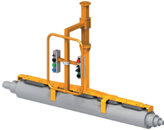
Vakuumtraverse für Duktorwellen LAM - Nr. LVA 5901