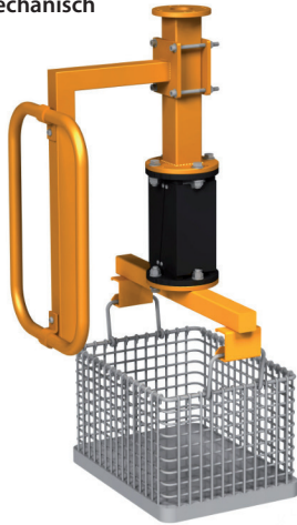
Hakentraverse mit Waage für Transportkörbe LAM - Nr. LHA 0209