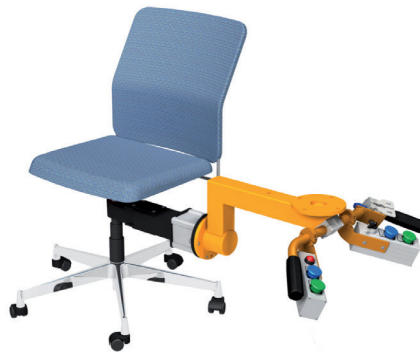
Scherenspanner für Bürostühle LAM - Nr. LSP 1501