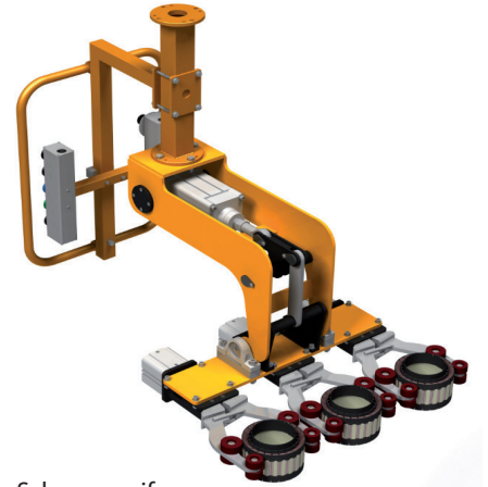
Scherengreifer für Statoren LAM - Nr. LSP 0608