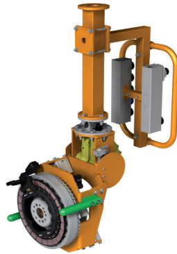
Greiftraverse für Statoren LAM - Nr. LPP 8201